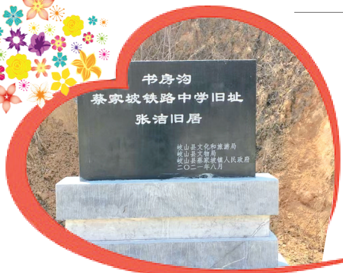
草坡村张洁旧居纪念碑

“春天到了，又到了挖荠菜的时节。这两天，在蔡家坡草坡村的田地里时常能看到三五成群的人们，带着准备好