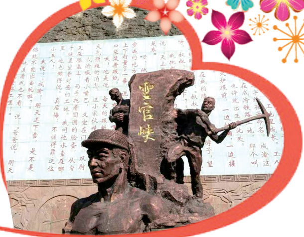
灵官峡石壁上雕刻着杜鹏程的《夜走灵官峡》