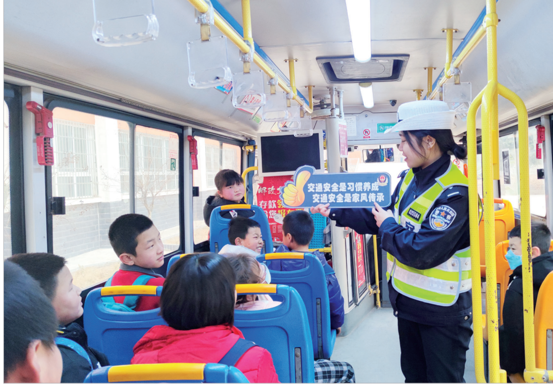
民警给学生们讲解乘坐定制公交的注意事项