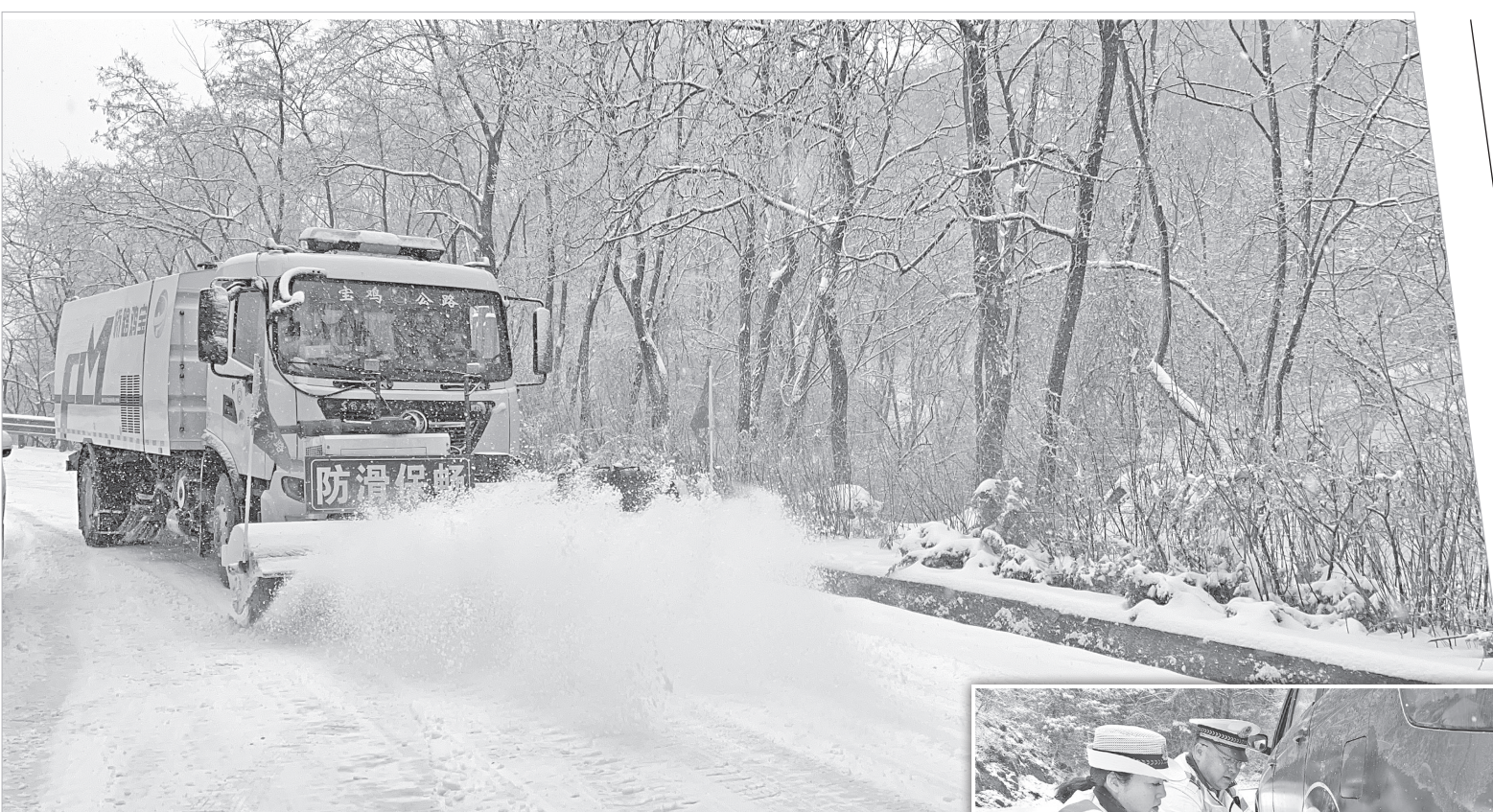
市公路局开展除雪保畅作业

编者按：受短波槽东移影响，这两日，我市出现大范围降温雨雪天气过程。各部门迅速部署防御应对措施，加强服务工作，最大程度降低此次天气过程造成的不利影响。