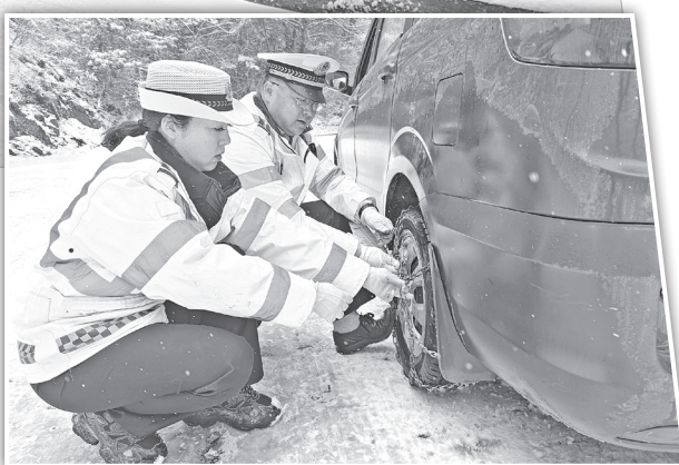
凤县交警帮往来车辆加挂防滑链