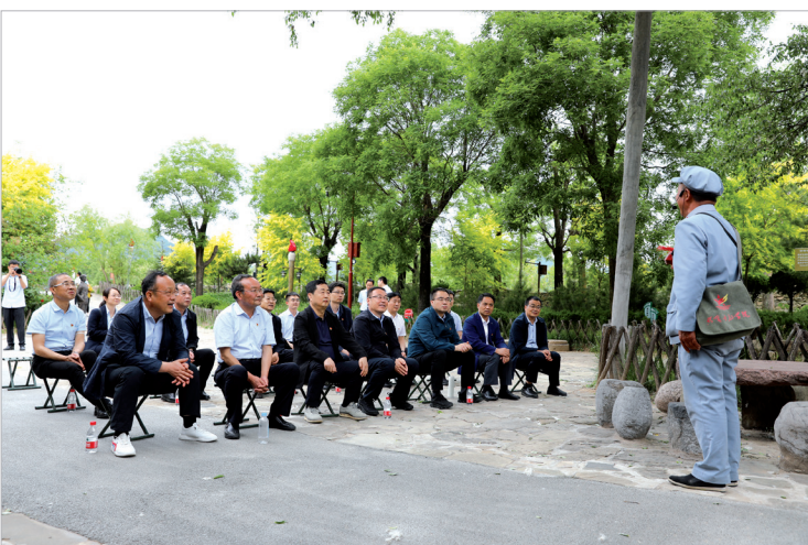
西凤集团党员干部在照金开展主题党日活动

已经过去的2022年，注定是西凤集团发展历程中极不平凡、极不寻常的一年。这一年，西凤集团全面贯彻落实“疫情要防住、经济要稳住、发展要安全”要求，以“高端化、全国化”战略为指导，聚焦“市场突破年”发展定位，以党建为引领、以质量为本、以市场为中心、以项目为抓手、以品牌为驱动，迎难而上，合力攻坚，取得了一系列令人瞩目的成绩，各项事业稳中有进，构建起高质量发展新格局！