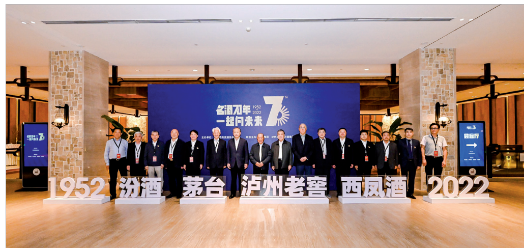
西凤集团员工参加中国名酒品牌70周年系列活动

情，西凤人没有犹豫，他们开展了一场席卷全国的营销攻势，在危机之中觅得了“先机”和“生机”。2022年初，春播会战吹响了西凤人市场攻坚的号角，集团相关负责人纷纷带队走访终端、拜访大商、邀请核心经销商回厂参观考察。紧接着，百城联动、红动中国系列活动在全国各个城市拉开帷幕……陕西、江苏、山东、福建、河北、天津、甘肃、河南、湖南等市场相继“燃起”中国红，名酒进军名企、高端品鉴、核心意见领袖培育、123场大型凤香盛宴……一系列卓有成效的市场活动，让西凤品牌价值得到