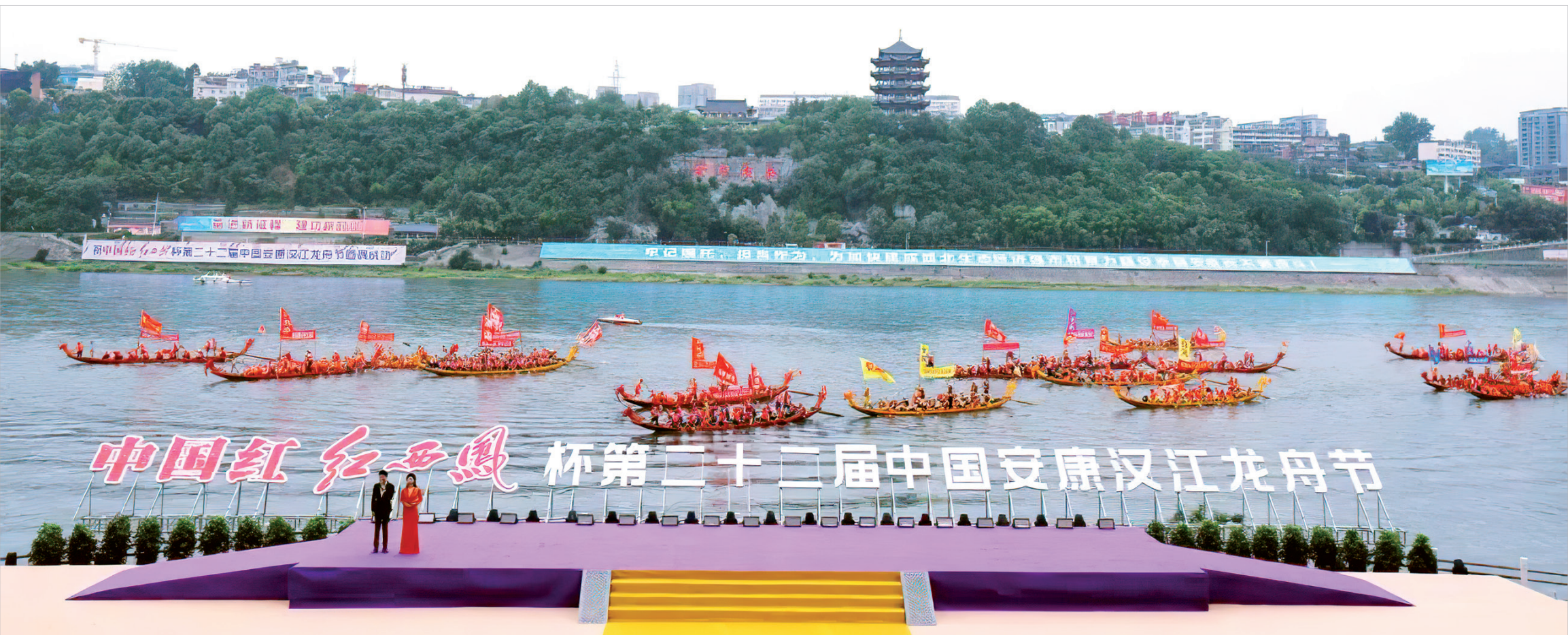
“中国红 红西凤”杯第二十二届中国安康汉江龙舟节于2022年端午节盛大举行