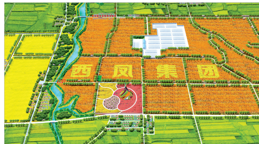
西凤现代农业规划蓝图

2022年，《西凤酒原产地地质地理环境特征研究》再出新成果：从科学角度找出了西凤美酒之所以美的地域和微生物特征，同位素检测技术构建了纯粮固态酿造白酒真实性判定指标体系，两项成果跻身陕西省技术创新引导专项计划。