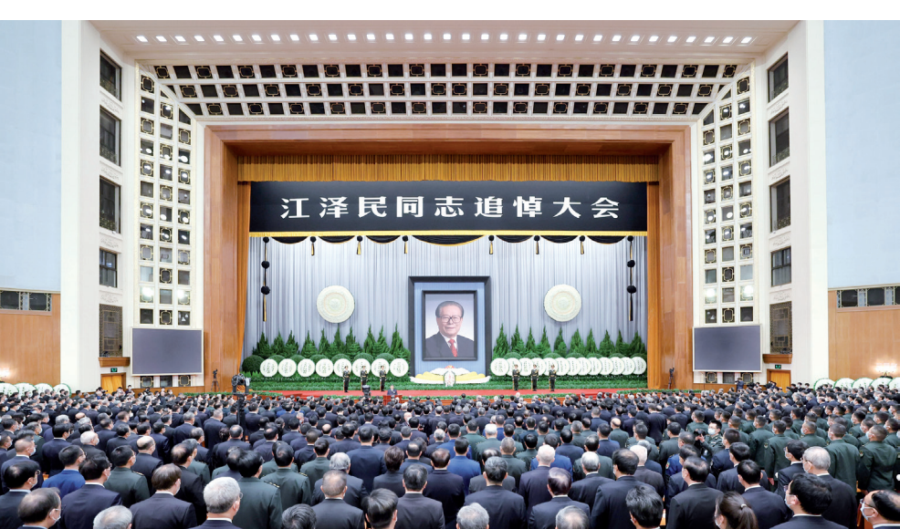
12月6日，中共中央、全国人大常委会、国务院、全国政协、中央军委在北京人民大会堂隆重举行江泽民同志追悼大会。