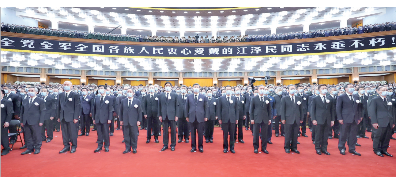
12月6日，中共中央、全国人大常委会、国务院、全国政协、中央军委在北京人民大会堂隆重举行江泽民同志追悼大会。习近平、李克强、栗战书、汪洋、李强、赵乐际、王沪宁、韩正、蔡奇、丁薛祥、李希、王岐山等参加大会。