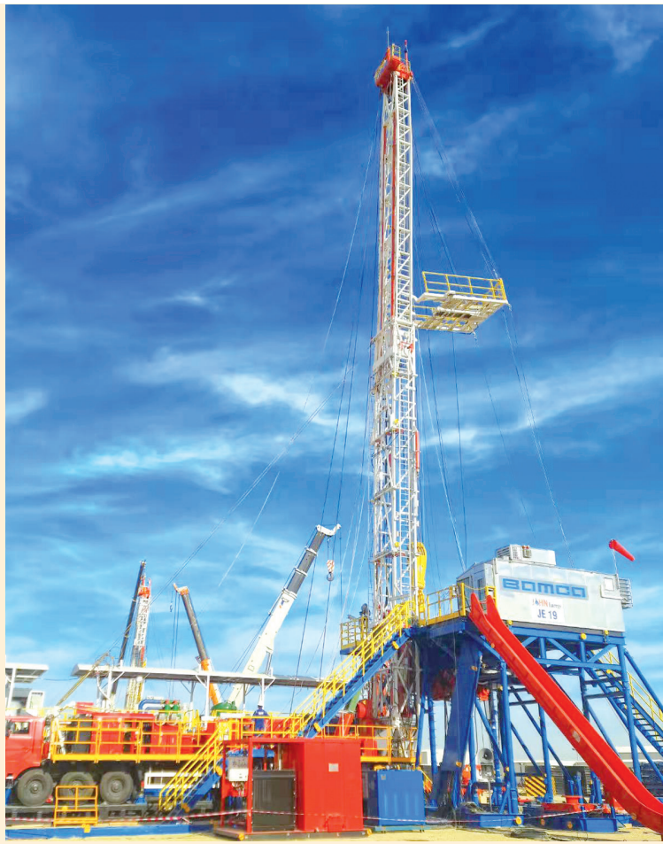
2021年出口到科威特的修井机(资料照片)

本报讯 近期，“第十六届中国上市公司价值评选”获奖名单发布，宝鸡钛业股份有限公司凭借稳健的发展态势和优异的市场表现，入选“中国上市公司成长100强”。这是我省唯一获此奖项的企业。