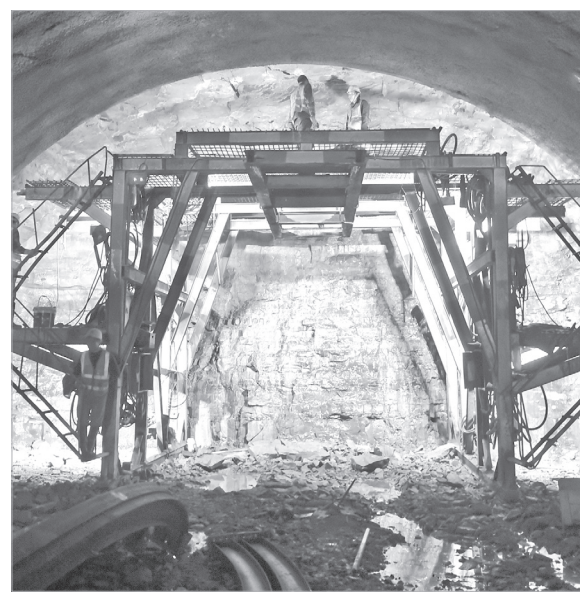
麟法高速野河山隧道施工现场