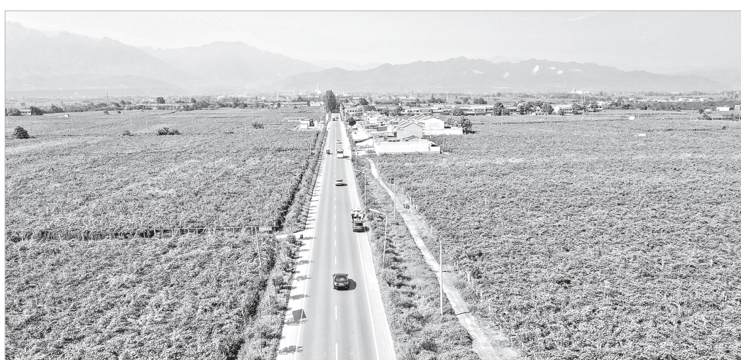
笔直畅通的道路扮靓了村庄

进入四季度,眉太高速公路项目施工一线,工人们在岗位上加紧施工,所到之处,“大干快干”的火热气息扑面而来。据了解,眉县至太白高速公路项目由中国铁建投资集团有限公司投资建设,线路全长75.435公里,按双向四车道高速公路标准建设,总投资约123亿元。眉太高速途经扶风、眉县、太白3县8镇,穿越秦岭北麓,沿途有太白山、青峰峡等著名旅游景点,旅游资源丰富,是陕西省文旅融合试点项目,对进一步加强关中地区与陕南地区的联系、完善陕西省高速公路网布局、实现陕西省县县通高速目标、畅通川陕交通大动脉及促进区域经济高质量发展具有重要意义。