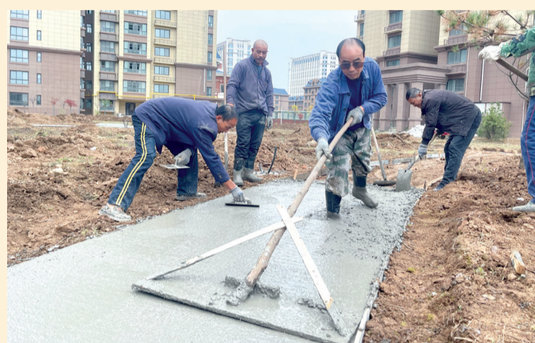
小区游园路面硬化