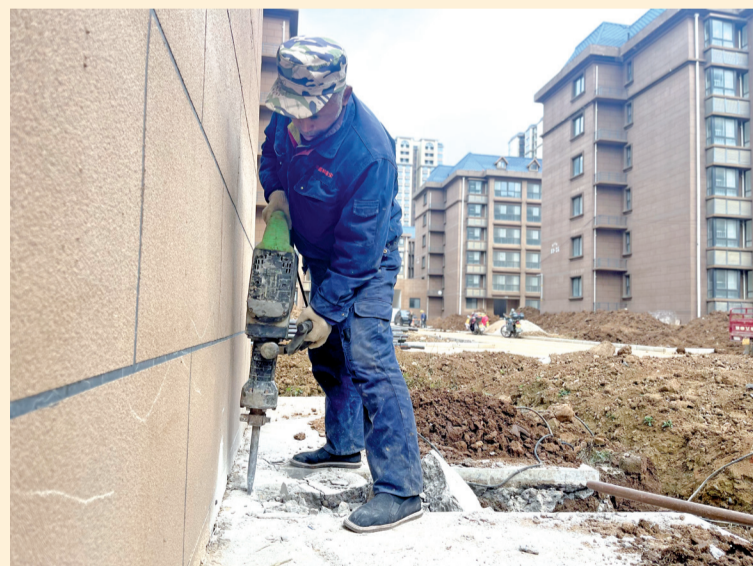
室外散水破碎作业