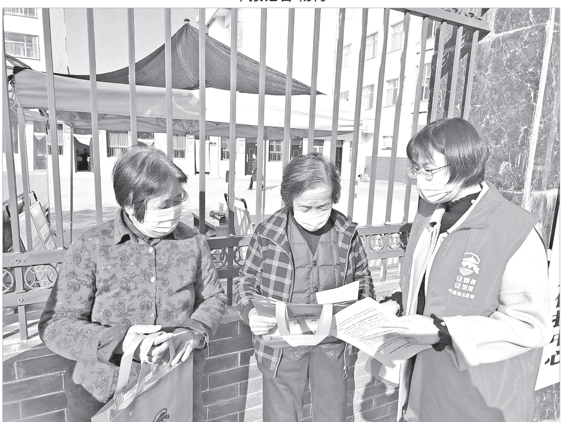
凤翔区域城关镇志愿者向群众发放“九率一度”宣传资料