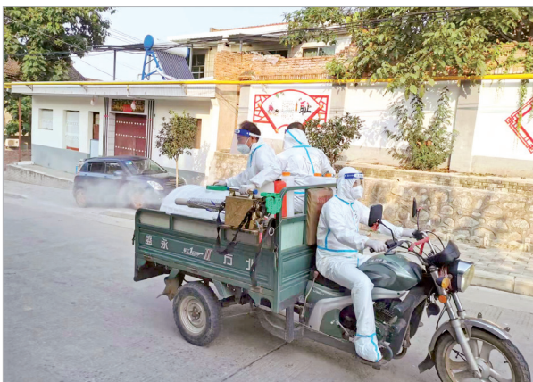
防疫人员在宝鸡高新区天王村做消杀