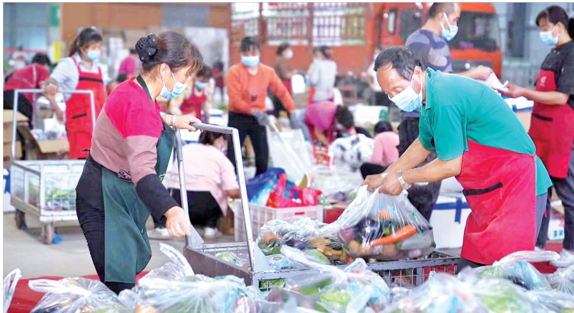
蔬菜保供企业组织工人分拣蔬菜