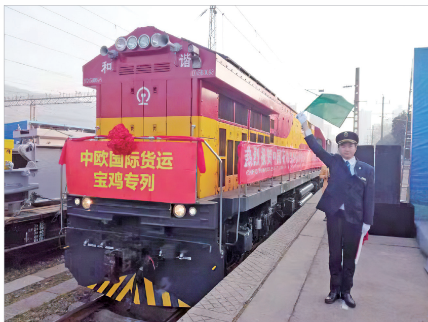
中欧国际货运宝鸡专列从宝鸡东站开行

为了打破货物出海的地理位置限制,宝鸡人一直在不懈努力。一方面积极筹建宝鸡机场,一方面抢抓历史机遇开通国际货运班列。如今,宝鸡机场正在建设当中,国际货运班列也逐渐从零星散发变成常态化发送。2019年2月1日,