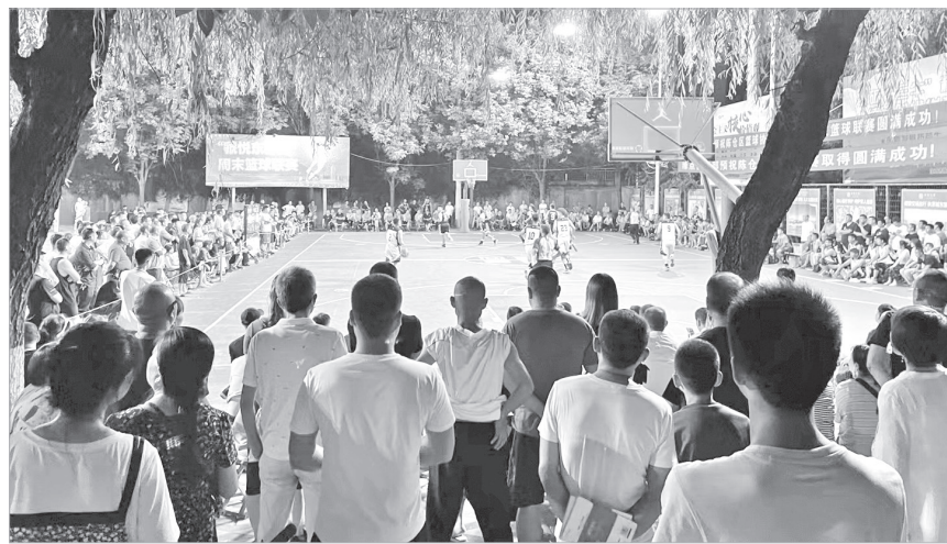
陈仓区周末篮球联赛现场观众如潮