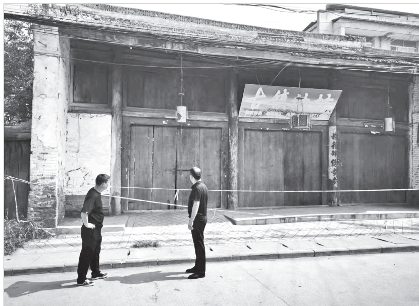
工作人员对危旧油坊进行管控

自建房的安全问题，不仅仅是各级党委政府的事，为进一步提升群众的安全意识和责任意识，我市充分利用广播电视、政府官网、抖音微信等平台，多形式开展自建房安全专项整治宣传和房屋安全教育，印发《危险房屋排查识别手册》60余万册，争取群众支持参与，营造出群防群治的浓厚氛围。