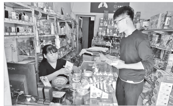
向群众发放《危险房屋排查识别手册》