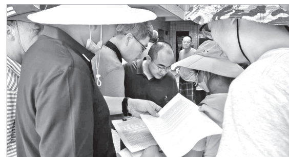
入户核对房屋信息