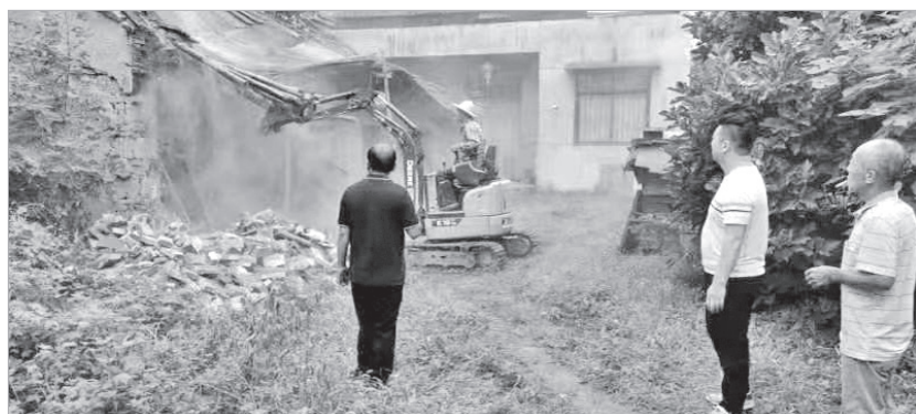
组织人员对危房进行拆除