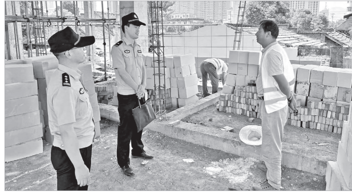
宝鸡东站派出所民警在虢镇火车站新建候车室施工现场进行走访调查

本报讯 近日,西安铁路公安处宝鸡东站派出所夏季铁路治安打击整治“百日行动”全面展开,这次行动将重拳打击破坏铁路运输安全、侵害人民群众合法权益的突出违法犯罪活动。