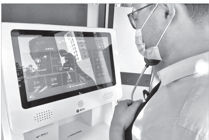
市民在“互联网无人律所”进行线上法律咨询

本报讯 “有了‘互联网无人律所’,老百姓遇到法律问题,随时都可以咨询,这就给我们配了在线法律顾问,这个