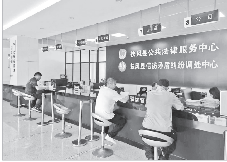
群众在扶风县公共法律服务中心办理业务

目前,全县基层党员、网格员、志愿者、调解员社会治理四支队伍在疫情防控、矛盾纠纷排查、平安创建等社会治理事项中积极发挥作用,民事民议、民事民办、民事民管的自治格局逐步形成。