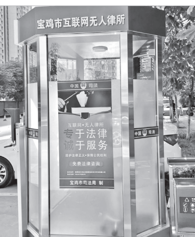
宝鸡市互联网无人律所