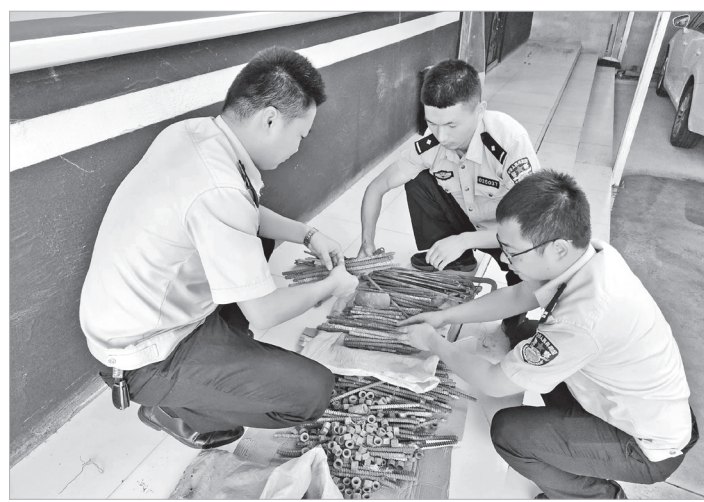
民警正在清点盗窃物品

本报讯 近日,扶风县公安局上宋派出所快速出击,破获一起盗窃案,抓获犯罪嫌疑人3名,为群众挽回经济损失1000余元。