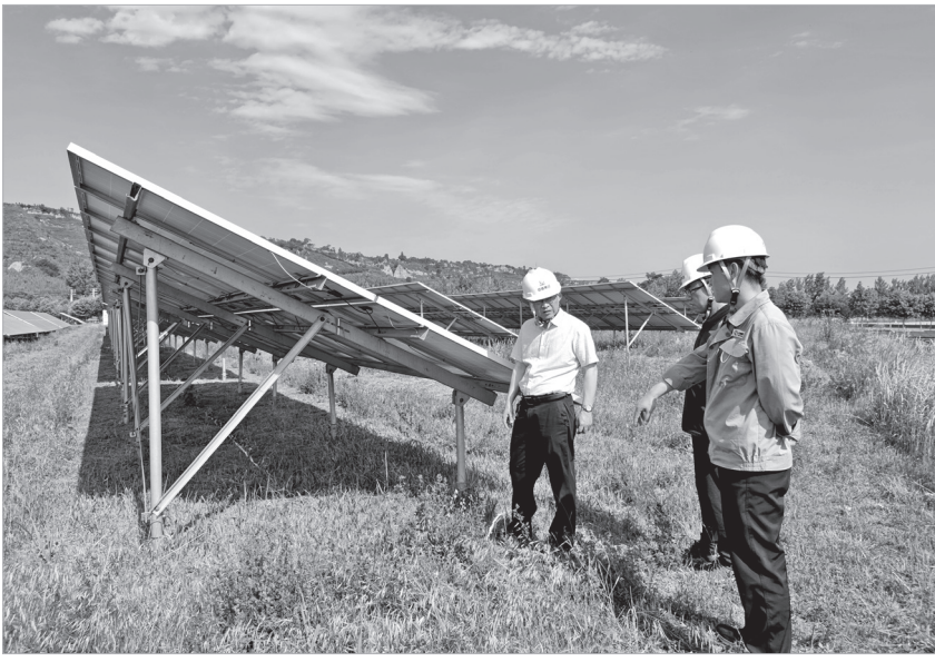
工行宝鸡分行员工到企业实地走访了解资金需求