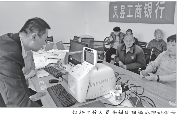
银行工作人员为村民现场办理社保卡

社保卡还能上门办理,你知道吗?5月初,工行宝鸡分行“社保卡便携制卡机”项目成功落地,有效解决了部分客户无法到店办理业务等难题,真正意义上实现了社保卡业务办理“一次到位”。据介绍,截至目前,该行已累计更换、办理第三代社保卡1700余张。