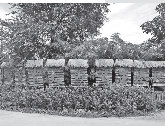
位于仰源村的黄胄美术写生基地