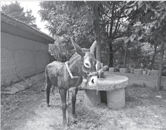
故居中的毛驴雕塑