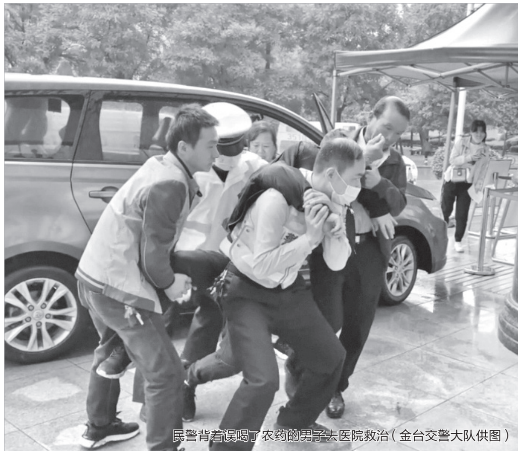
民警背着误喝了农药的男子去医院救治

本报讯 9月18日,陈仓区县功镇一男子误将农药喝下,家人拨打“110”求助。金台交警在接到转警电话后,仅用5分钟就将该男子护送到医院,为救治赢得了宝贵时间。目前,该男子已脱离危险。