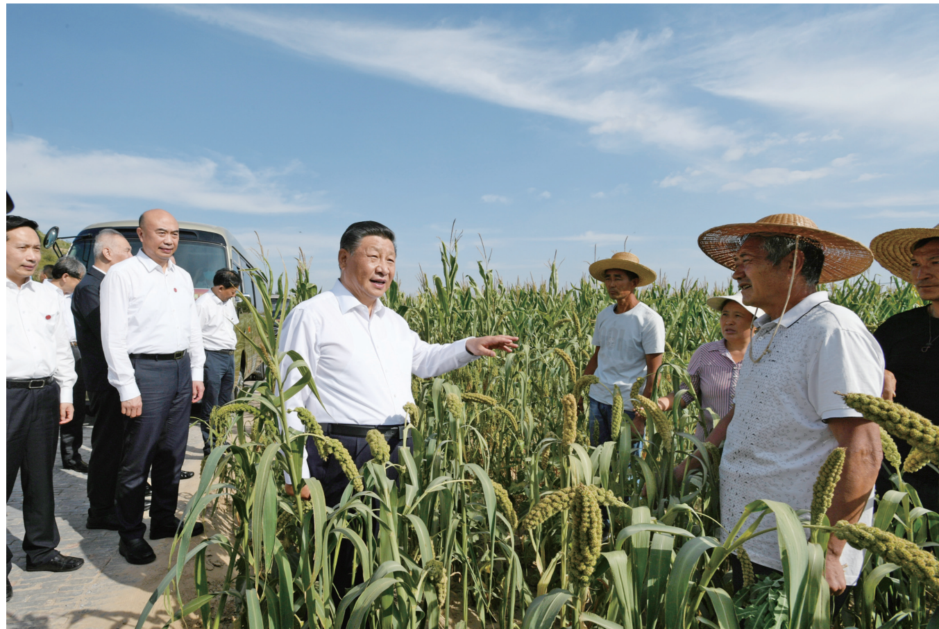
9月13日至14日，中共中央总书记、国家主席、中央军委主席习近平在陕西省榆林市考察。这是13日下午，习近平在米脂县银州街道高西沟村临时下车，察看粮食作物长势，同正在田间劳作的老乡拉家常。新华社记者 李学仁 摄

离开高西沟村，习近平来到位于米脂县城东南的杨家沟革命旧址。1947年底，毛泽东同志率领中央机关来到杨家沟村，在这里战斗生活了4个多月，指挥了全国解放战争和西北战场，领导开展土地改革运动。习近平参观中共中央“十二月会议”旧址、毛泽东旧居、周恩来旧居等，追忆革命历史，缅怀革命先辈丰功伟绩。习近平强调，政策和策略是党的生命。一百年来，我们党之所以能够统一思想、统一步调、团结一致向前进，之所以能够取得革命、建设、改革的伟大胜利和辉煌成就，就在于我们坚持马克思主义指导，高瞻远瞩、见微知著，既解决现实问题，又解决战略问题，准确判断和把握形势，制定切合实际的目标任务、政策策略。（下转第二版）