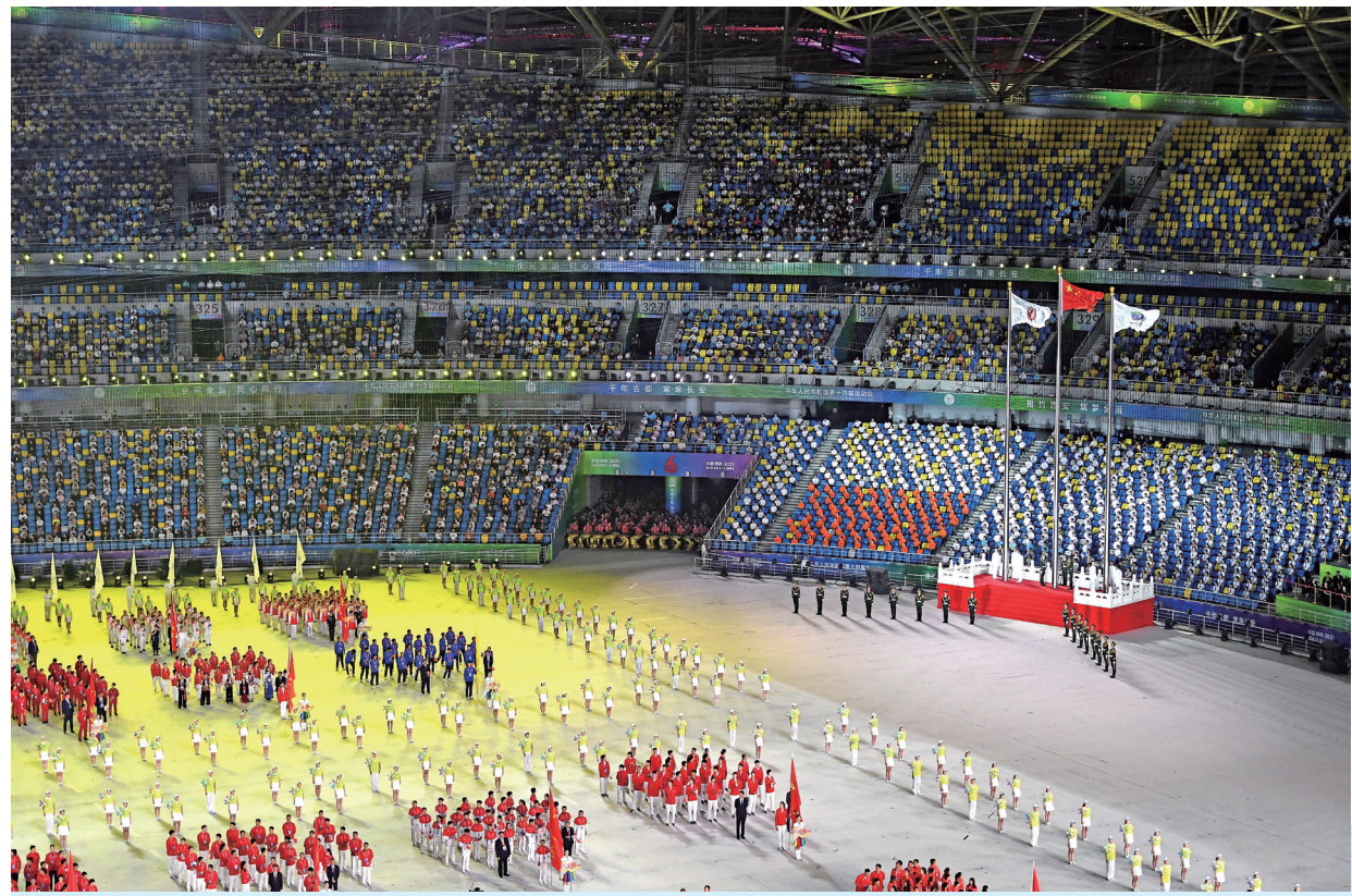
9月15日晚，中共中央总书记、国家主席、中央军委主席习近平在陕西省西安市出席中华人民共和国第十四届运动会开幕式并宣布运动会开幕。