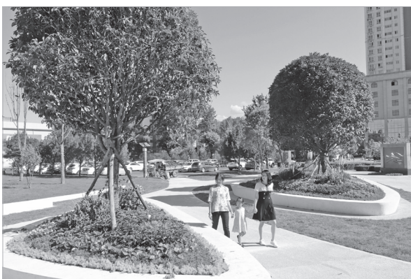
市体育场门前的口袋公园