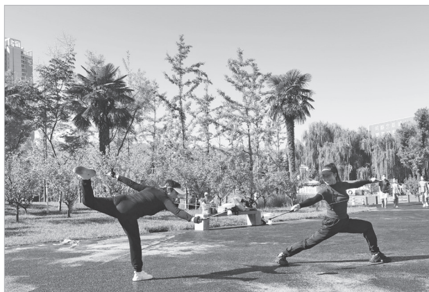
市文化艺术中心附近游园里的健身者

据了解，今年，我市还计划在市区新建多个400平方米以上的“口袋公园”，打造“出行300米见绿、500米见园”的“15分钟宜居生态圈”，形成“口袋公园—城市公园—外围郊野公园”多层次全时段绿色休闲圈，让宝鸡成为“城在林中、绿在街中、生活在景中”的美丽城市。