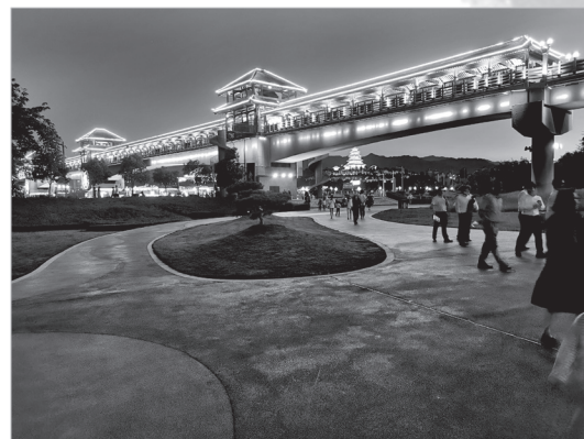
东岭廊桥下的公园游人如织