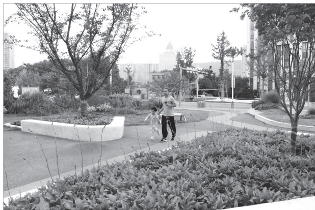
蟠龙大桥北头的口袋公园