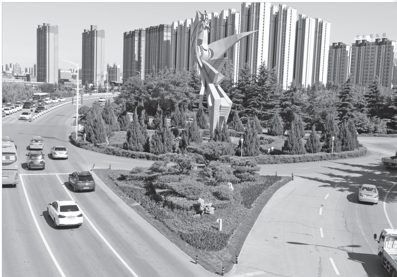
人防隧道南口的小游园