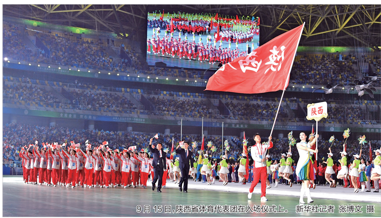
9月15日,陕西省体育代表团在入场仪式上。