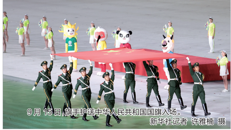
9月15日,旗手护送中华人民共和国国旗入场。

代表等,并同大家合影留念。习近平同大家亲切交流,勉励他们奋力拼搏、再创佳绩。 丁薛祥、刘鹤、许其亮、孙春兰、陈希、蔡达峰、卢展工、何立峰参加上述有关活动。 第十四届全运会将于9月27日闭幕,共有1.2万余名运动员参加竞技比赛项目,1万多名群众运动员参加群众赛事活动。