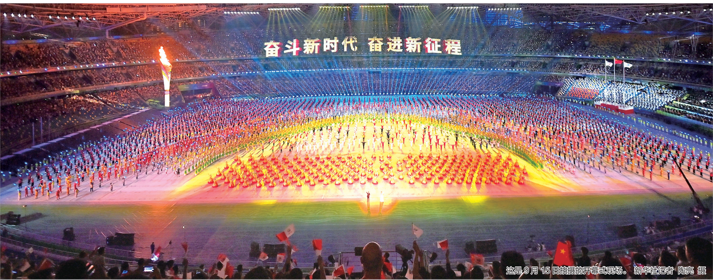
这是9月15日拍摄的开幕式现场。