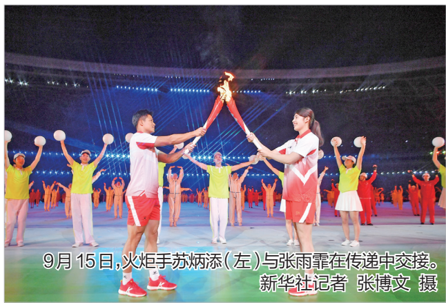
9月15日,火炬手苏炳添(左)与张雨霏在传递中交接。新华社记者 张博文 摄

(上接第一版)要始终坚持和完善党的领导,不断提高党科学执政、民主执政、依法执政水平,充分发挥党总揽全局、协调各方的领导核心作用。要坚持马克思主义基本原理,用马克思主义观察时代、把握时代、引领时代,同时坚持实事求是,从我国实际出发,不断推进马克思主义中国化、时代化。习近平指出,要充分运用红色资源,深化党史学习教育,赓续红色血脉。 14日上午,习近平前往中共绥德地委旧址,仔细察看旧址布局和部分复原场景,参观有关专题展陈。习近平指出,回顾这段厚重的革命历史,老一辈革命家坚持“党的利益在第一位”,坚持“站在绝大多数劳动人民的一面”,坚持“把屁股端端正正地坐在老百姓的这一面”,有着重大教育意义。中国共产党领导人民取得革命胜利,是赢得了民心,是亿万人民群众坚定选择站在我们这一边。我们要继承发扬革命传统和优良作风,始终把人民利益放在最高位置,不忘初心、牢记使命,贯彻党的群众路线,尊重人民主体地位,始终同人民站在一起、想在一起、干在一起。 随后,习近平来到绥德实验中学,先后走进教室、操场,观看同学们书法练习和体育锻炼,同大家亲切交流。他指出,中华文明源远流长、绵延不断,基础在教育。实现中华民族伟大复兴,基础在教育。我们办教育,就是要提高人民综合素质,促进人的全