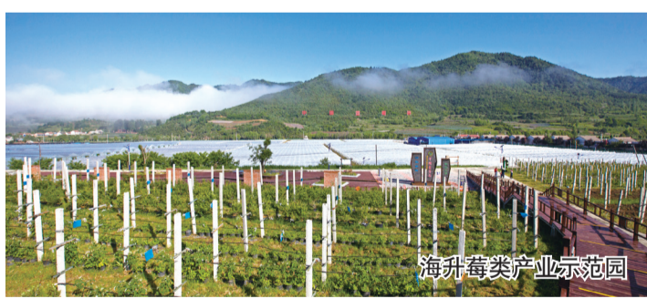
海升莓类产业示范园

县域经济飞速发展。 “生态立县、特色富民”增强县域经济综合实力，财政收入建县初为56.93万元，“十三五”末达到7535万元，增加了132倍；城镇人均纯收入建县初为306元，“十三五”末达到31467元，增加了103倍；农村人均收入建县初为20元，“十三五”末达到19940元，增加了997倍；城乡居民储蓄存款余额“十二五”初为95593万元，“十三五”末增加到268847万元，增加了181%。