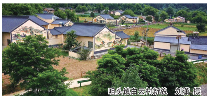
咀头镇白云村新貌