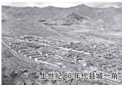
上世纪60年代县城一角