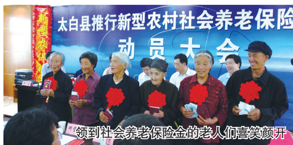
领到社会养老保险金的老人们喜笑颜开

六十载风雨兼程，六十载春华秋实。站在“两个一百年”奋斗目标的历史交汇点上，太白县委、县政府将团结带领全县人民始终坚持以习近平新时代中国特色社会主义思想为指导，把人民对美好生活的向往作为奋斗目标，沿着“四县”建设的宏伟蓝图，初心如磐、使命在肩、苦干实干，奋力谱写新时代追赶超越新篇章！