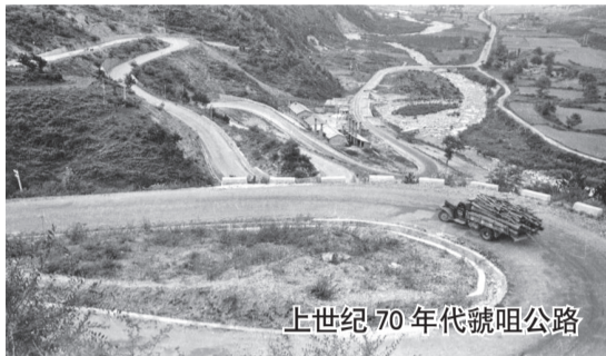
上世纪70年代虢阻公路