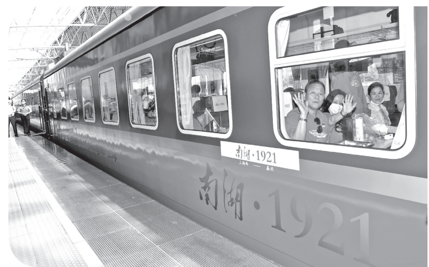
2021年6月25日,乘坐Y701次“上海至嘉兴红色旅游列车”的旅客在铁路上海西站准备出发。这是一趟红色教育主题列车,连接起上海中共一大会议址与嘉兴南湖。