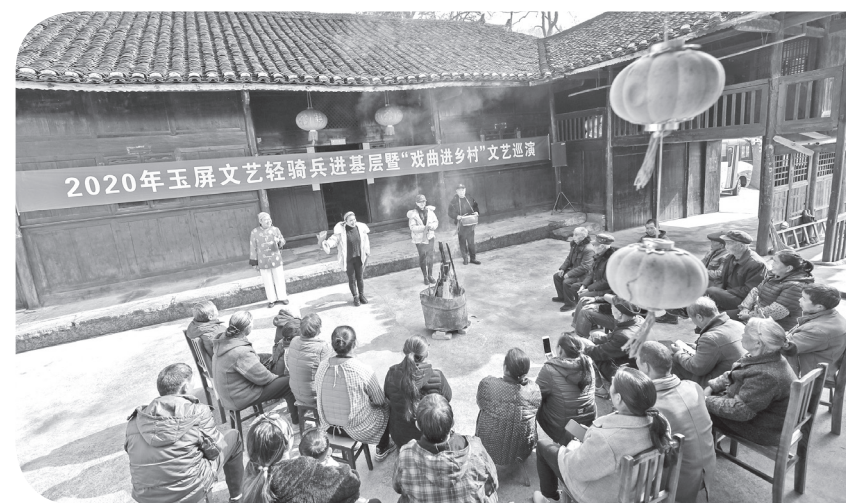
2020年11月30日,在贵州省铜仁市玉屏侗族自治县新店镇新店村农家院坝,文化志愿者为村民表演小品。 新华社发