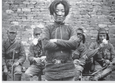
这张照片是侵华日军随军记者山下弘一于1938年5月中旬在安徽和县拍摄的

对于那次考试期间的一些事，已经在记忆中模糊了，但唯一一件事让我至今难忘，那就是县上为我们这些农村来的考生提供了临时宿舍。我不用住宿而用宿营一词，是为了更准确地表达当时的栖身条件。因为那是在县城的东关小学里腾出几间大教室，在教室里铺上麦草，供考生休息。一座教室我们二三十个人挤在一起和衣而睡，虽互不相识，却友善相处，大家其乐融融。条件虽然很简陋，但对我们这些穷学生来说那已经是最好的待遇、最大的恩惠了。我每每想起这件事，内心就涌起一股暖流。 高考作为全国的大考、国考，一年一度依然如期进行。近几年，全国的高考录取率都达到了百分之八十以上，而我们那时不到百分之四。如此巨大的反差虽然没有赶考之困、赶考之难，但对于高考的重视程度却达到了空前的高度。应考这独有的风景，只有在中国大地上热烈生长，频频亮眼。这期间，一切为高考让路，一切为了考生的社会关爱与呵护的暖风吹遍神州，每一个考点内外皆洋溢着礼让与微笑。从旧时的盗贼不打劫赶考的举子，乡绅帮助穷困的书生重整旗鼓，这些来自史册或戏文里的感人故事，到现在每年高考我所处的县城，全城在建工地停工、娱乐场所歇业，政府为此创设良好的考试环境，以及群众自发组织的爱心送考车队等等，这些让人感到从古至今这个国家与民族对知识的敬畏，对读书人的敬重。尤其是当今时代，我们对高考制度的共同建设与维护，对青年学子的关怀与支持，就是对国家和民族未来的热切关注和高度期盼，这也正是我们实现中国梦的天空也开起了玩笑，下起了毛毛雨，头发被淋湿了，不知是雨水还是汗水从脸上滴下来，我们