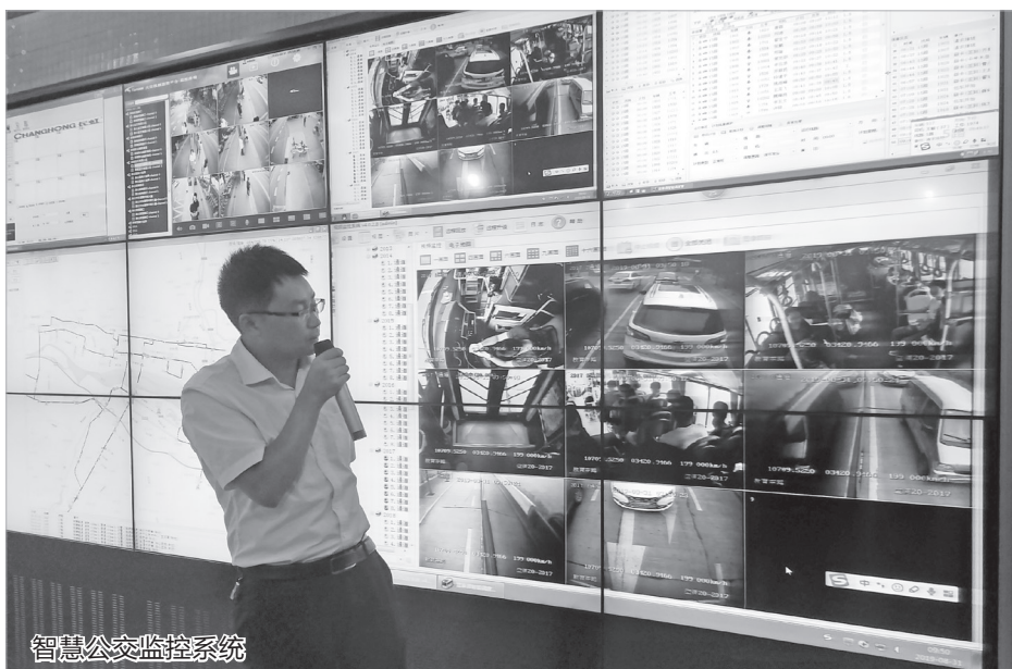
智慧公交监控系统

此外,我市积极布局,通过一揽子优惠政策,积极支持企业的创新平台建设,谋求未来之变局。目前,西凤酒公司组建的中国轻工业凤香白酒技术工程研究中心获中国轻工业联合会发文批文,宝鸡钢管责任有限公司申报的“陕西省高性能连续管重点实验室”被认定为省级重点实验室,渭滨传感器、蟠龙高新区科创园等6家申报的省级科技企业孵化器已经通过答辩,陕西省太白山太白七药科技示范基地成果获批。