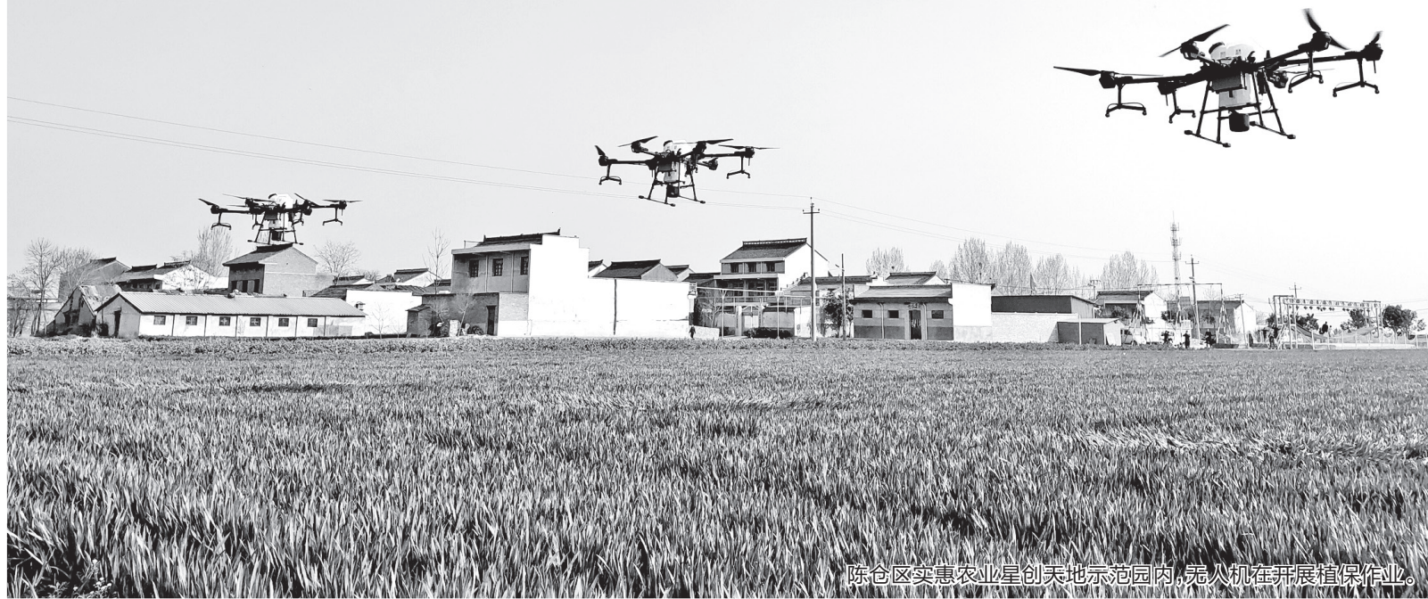
陈仓区实惠农业星创天地示范园内,无人机在开展植保作业。

秦创原创新驱动平台(以下简称“秦创原”),是陕西省最大的孵化器和科技成果转化“特区”。它的使命是建设立体联动“孵化器”,科技成果转化“加速器”,科技成果产业化“推进器”,使之成为全省创新驱动发展总平台、全省创新驱动总源头。