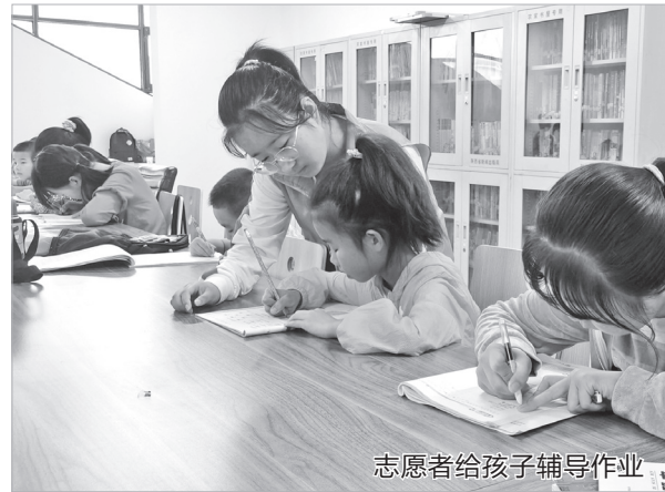
志愿者给孩子辅导作业