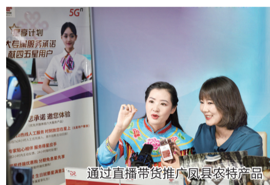
通过直播带货推广凤县农特产品