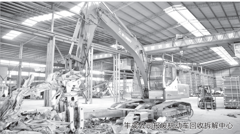
丰茂公司报废机动车回收拆解中心