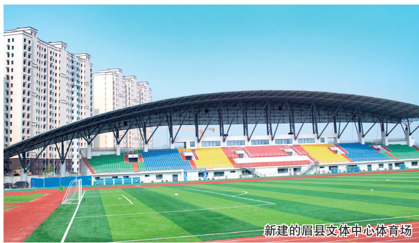
新建的眉县文体中心体育场