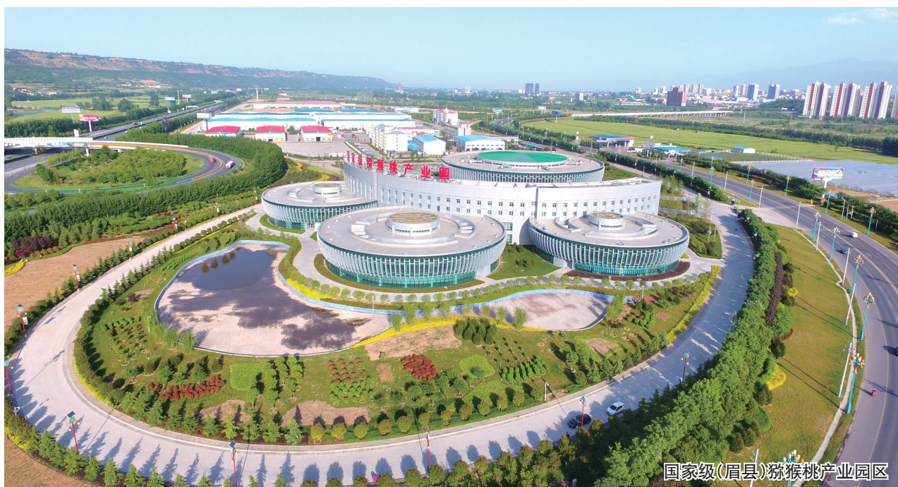
国家级(眉县)猕猴桃产业园区

“前生产”增产量、提品质、保安全,“后整理”树品牌、扩市场、要效益,推进产业转型升级。依托国家现代农业产业园,招引百贤酒业、千裕酒业、合德堂、秦美源果品公司等企业入驻链条,以猕猴桃为原料进行深加工,年加工量达5万吨,研发生产的果酒、果汁、果脯、面膜等,产值达10亿元,不可估量的市场潜力让前来入驻的企业接踵而至。现如今,“眉县猕猴桃”品牌价值128.33亿元,2020年