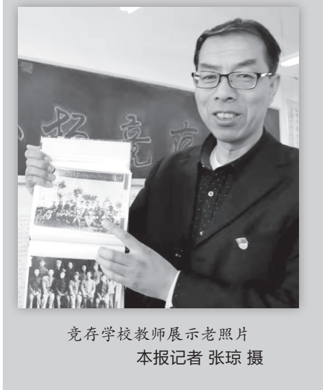
竞存学校教师展示老照片

提起张寒晖的名字,即使上年龄的凤翔人也都感到陌生,但一提起《军民大生产》《松花江上》《去当兵》这些诞生于上世纪三四十年代至今仍传唱不衰的著名歌曲,我想读者们就会明白。这三首名曲的词曲作者就是张寒晖。