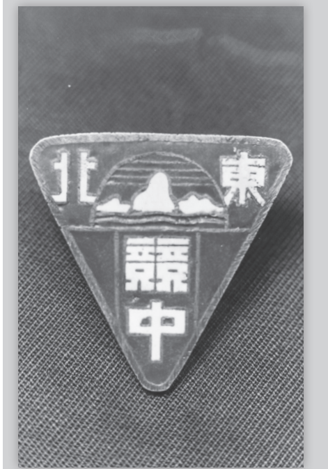
东北竞存学校校徽