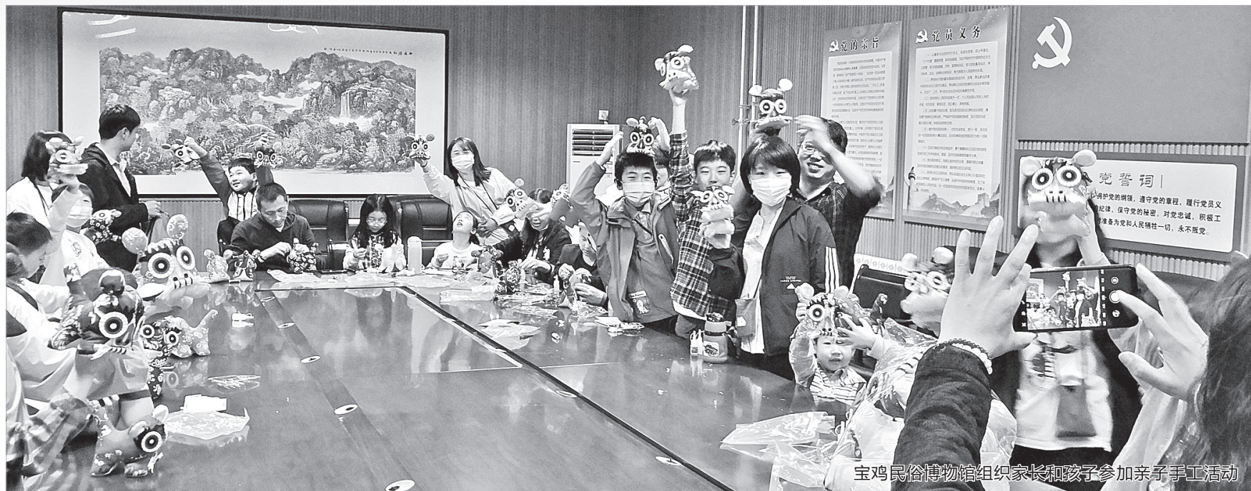
宝鸡民俗博物馆组织家长和孩子参加亲子手工活动

为此，我市将建设“博物馆之城”纳入关中平原城市群副中心城市总体框架，并在《关于建