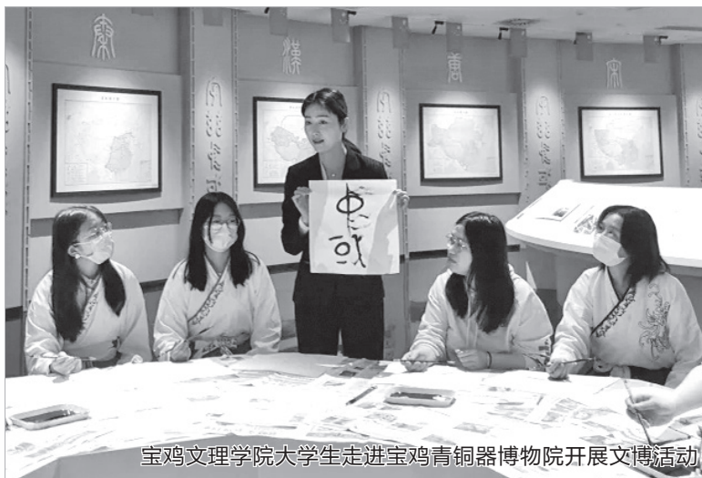
宝鸡文理学院大学生走进宝鸡青铜器博物院开展文博活动

博物馆是城市的公共文化服务机构，建设“博物馆之城”，就是要充分发挥博物馆的公共文化服务效能，使其成为坚定文化自信、传承历史文脉、涵养城市精神、丰