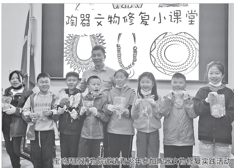
宝鸡周原博物院邀请青少年参加陶器文物修复实践活动