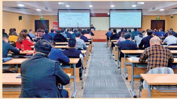
聆听专家教授讲座，开阔眼界，启迪思路。

观照对比，方知不足；奋起直追，才会不虚此行。企业家们深知，“西迁精神”与宝鸡市中小企业协会企业家