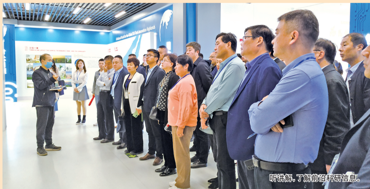
听讲解，了解前沿科技信息。

宝鸡市中小企业协会的企业家素有担当进取的优良品质，敢为人先的使命感，通过此次启智铸魂，一定会实现大踏步追赶超越的美好蓝图，为宝鸡高质量发展增光添彩，再续华章！