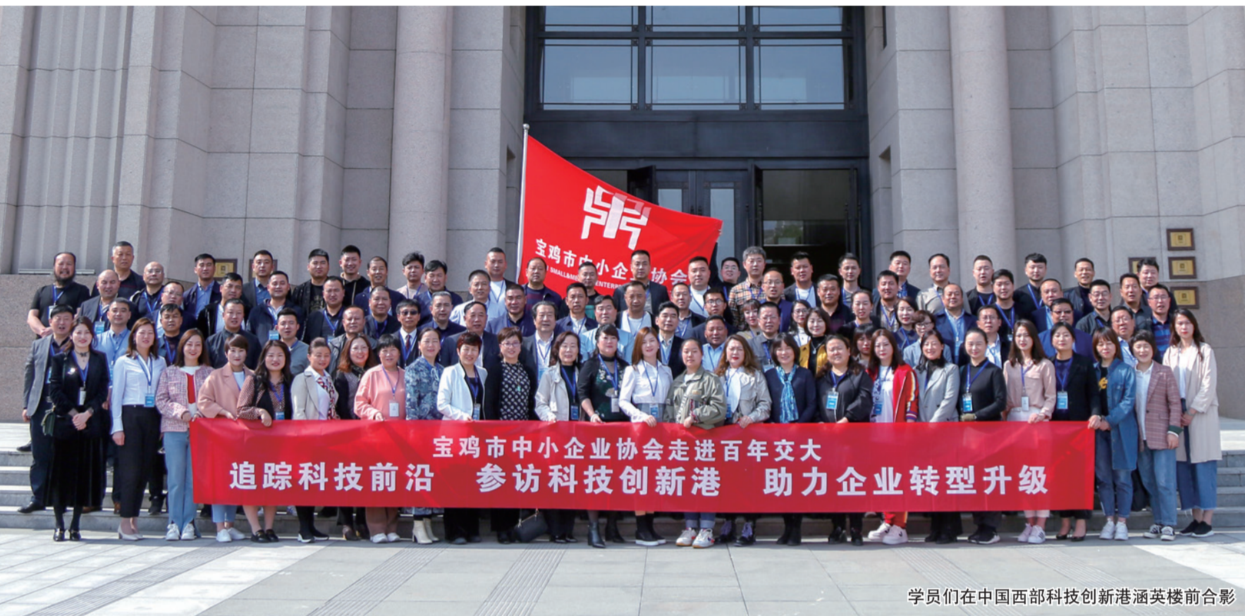
学员们在中国西部科技创新港涵英楼前合影