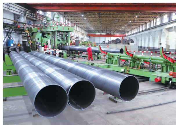
宝鸡石油钢管有限责任公司生产车间,工人在焊接钢管。