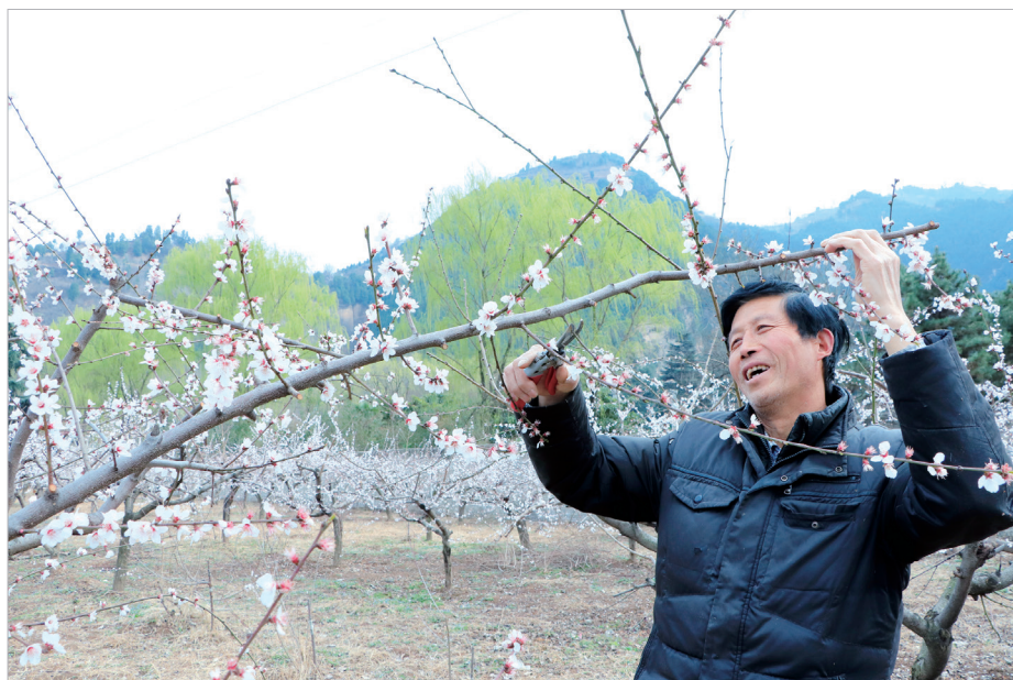
宝鸡高新区天王镇钓鱼台村,果农在修剪桃树。