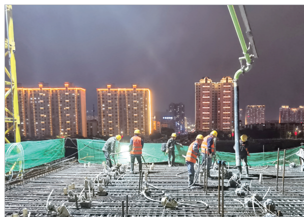
团结大桥项目建设现场,工人挑灯夜战。