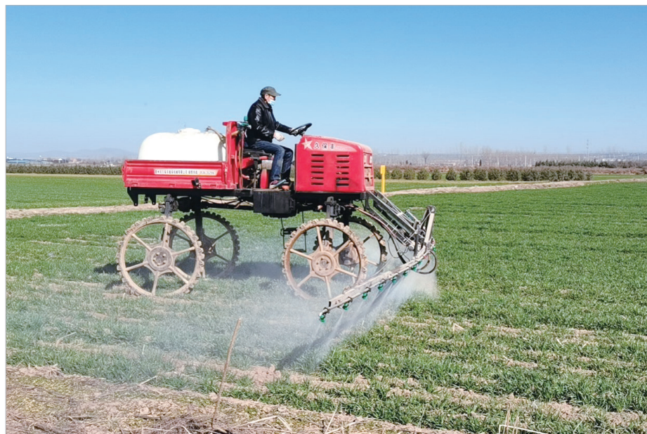
陈仓区周原镇有礼村,大型农机给小麦喷洒农药。