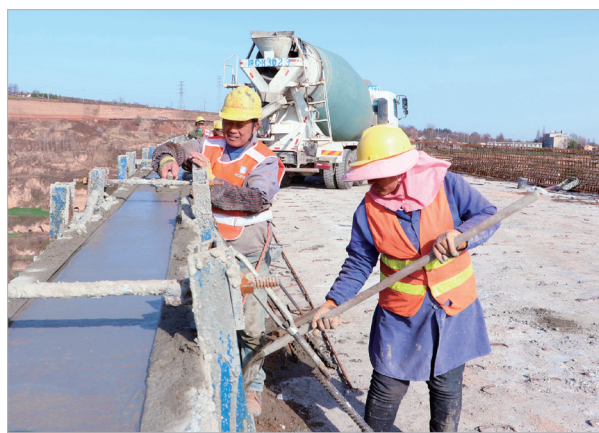
在建的长寿沟大桥上,工人在加紧施工。