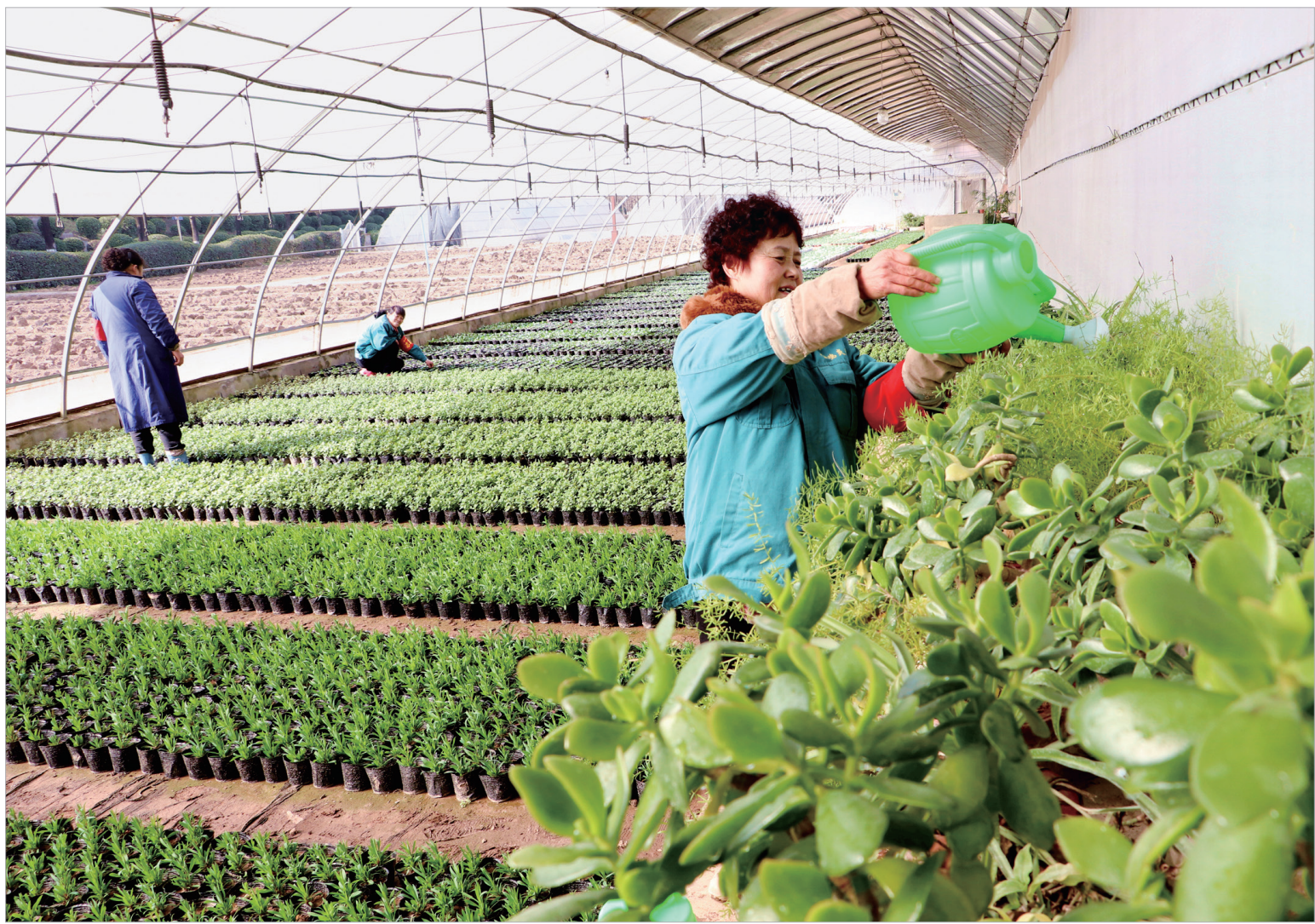
市炎帝园花草苗木基地,园林工人给花卉浇水。