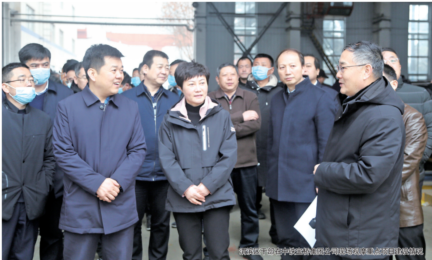
渭滨区干部在中铁宝桥集团公司现场观摩重点项目建设情况

一年之计在于春。2月27日，伴随着一场贵如油的及时春雨，渭滨区委、人大常委会、区政府、区政协领导带领区级各部门及各镇街党政负责人100余人，放弃节假日休息，举行2021年第一次重点项目建设现场观摩会。一天来，与会人员不负春光、只争朝夕、马不停蹄走进工业、商贸、民生、基础设施等14个项目现场，看亮点、找差距、议措施、谈打算，为“十四五”开好局、起好步，奋力追赶超越、推动高质量发展鼓干劲、添动力、强信心。