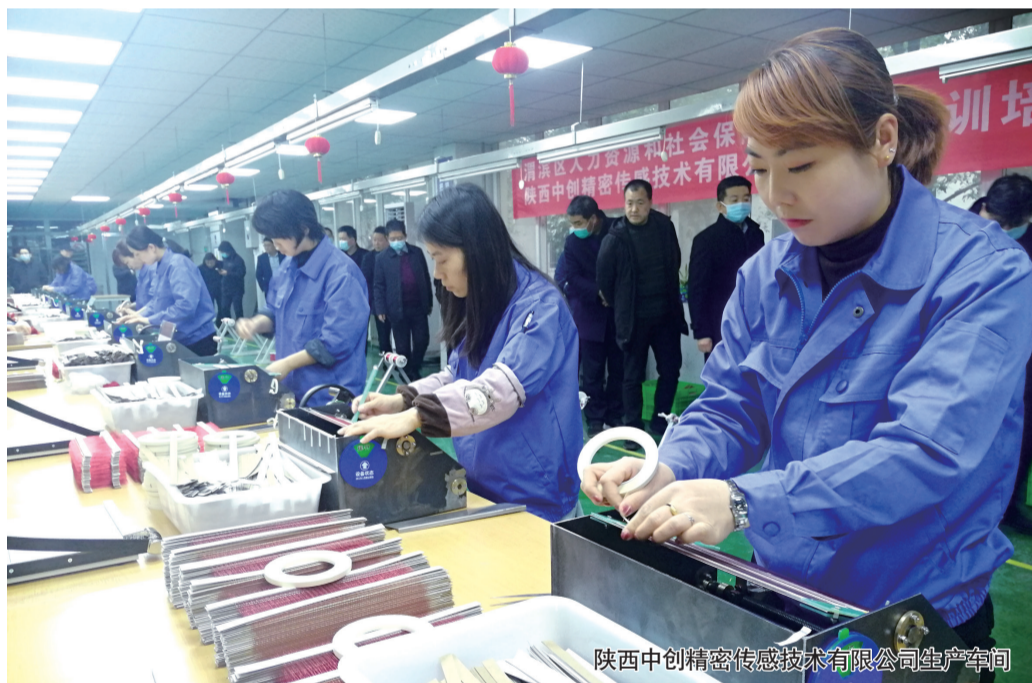
陕西中创精密传感技术有限公司生产车间

思路决定出路，目标引领方向。为了让这些重点项目落地生根、开花结果，渭滨区敢与天地争春回。近日，围绕凝心聚力抓项目、心无旁骛干项目、比学赶超促项目，区上相继出台了《“夺争树”和精彩计划实施方案》(综合考核夺优秀、单项工作争先进、特色工作树品牌、个人出彩、工作多彩、渭滨精彩)、《“三争三比”活动实施方案》(争项目、争资金、争政策，比体量、比进度、比位次)、《关于积极实施项目带动战略加快项目建设的十条措施》等文件，