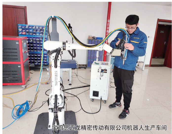
宝鸡思迈龙精密传动有限公司机器人生产车间