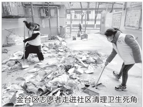
金台区志愿者走进社区清理卫生死角

本报讯 12月25日下午,金台区、渭滨区、陈仓区和宝鸡高新区组织千余机关干部、社区群众和志愿者,走进各自辖区的老旧小区、背街小巷,清理卫生死角,打扫楼道卫生,还小区干净整洁面貌。