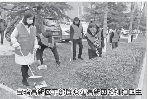
宝鸡高新区干部群众在高新四路打扫卫生