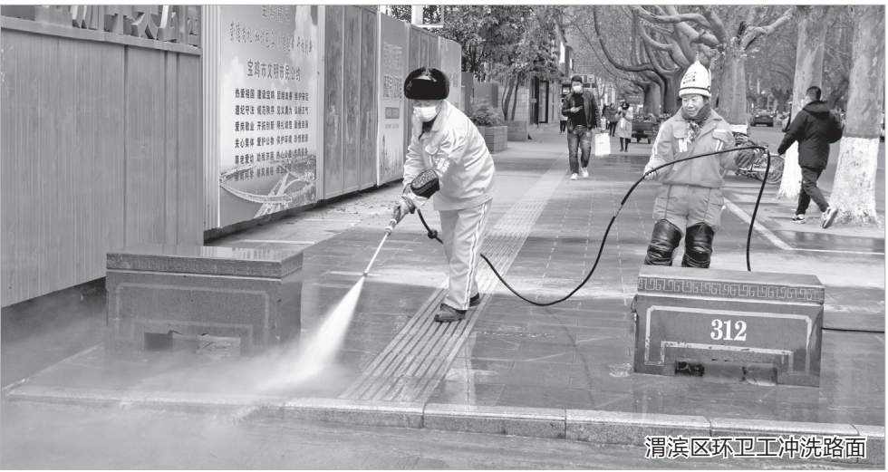
渭滨区环卫工冲洗路面