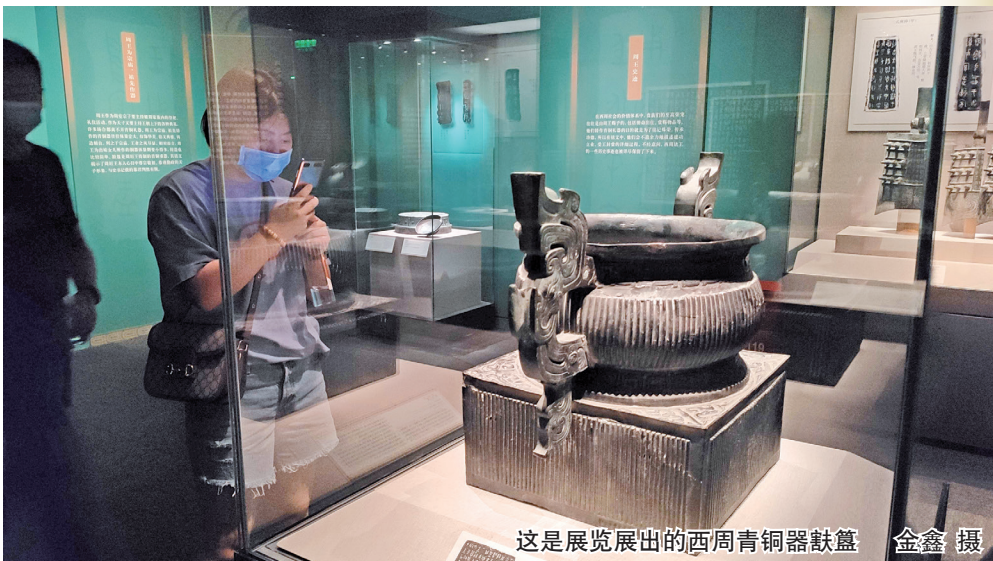
这是展览展出的西周青铜器猷簋