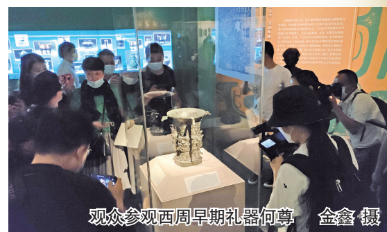
观众参观西周早期礼器何尊

是桀和纣王齐名的暴君。到底哪一位才是真的周厉王?据研究,厉王的“专利”更多是一种为挽救王朝的衰亡而加强王室财政的举措。改革触动了大贵族的利益,最终以失败而告终。其实,历史上真实的周厉王与史官笔下奢侈专横的暴君形象或许存在相当大的差异。而猷簋铭文为我们重新认识周厉王提供了宝贵的资料。四是铭文展陈出新。在铭文展示方面,尽量将青铜器铭文以完整、清晰、可观的方式呈现给观众,盖上有铭文的青铜器尽量分离展示。在重点展示青铜器铭文的基础上,突出展示青铜器造型的庄重、美观,使整个展览有看点、值得看。青铜器铭文以照片、拓片、视频解读、多媒体数控等多元手段立体化呈现在展览的各个位置,释文以简体形式对应排列,方便观众阅读、参观。功夫不负有心人,本次展览达到了预期效果,并在很多方面的效应超过了预期。