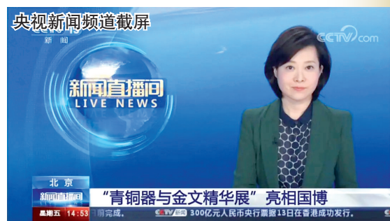
“青铜器与金文精华展”亮相国博