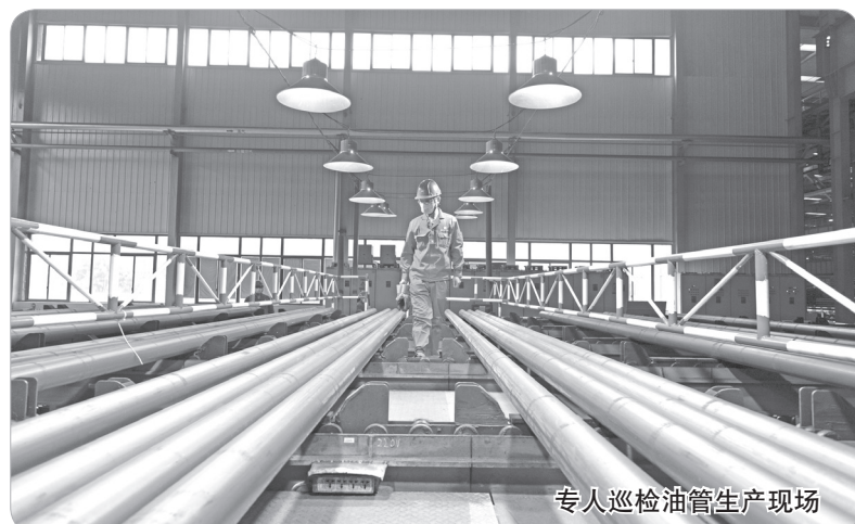
专人巡检油管生产现场

崖寺等一大批享誉海内外的知名景区。此次为我市免费派送的景区通票,包含崆峒山、大云寺·王母宫、龙泉寺、云崖寺景区门票,总价约825万元。市民可关注“平凉文旅”“崆峒山智慧旅游”微信公众号,扫描二维码免费领取。领取成功后,获得通票卡券,存至微信卡包,游览时直接使用。(温瑶瑶)