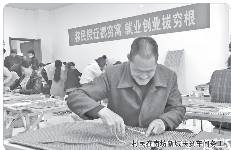
村民在南坊新城扶贫车间务工