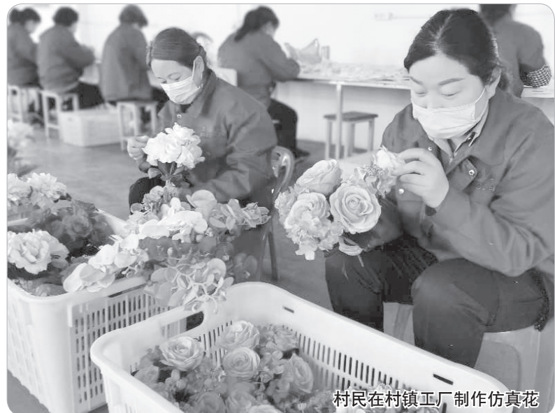
村民在村镇工厂制作仿真花