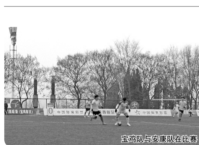
宝鸡队与安康队在比赛