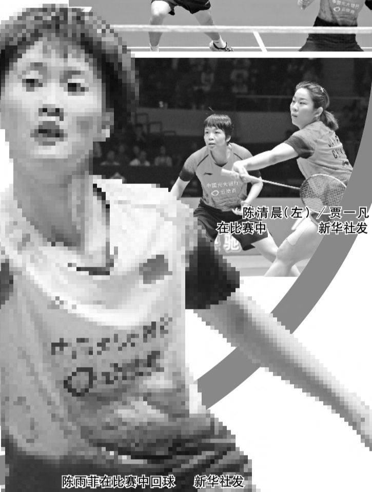
陈雨菲在比赛中回球