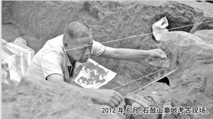
2012年6月,石鼓山墓地考古现场。