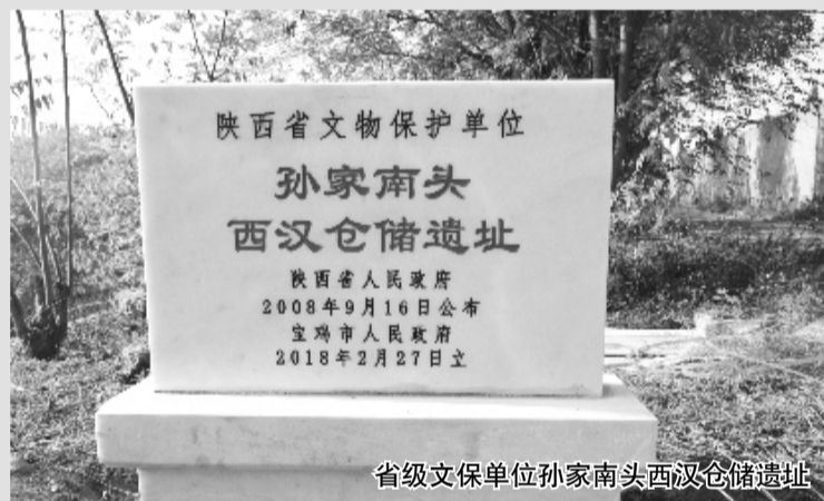
省级文保单位孙家南头西汉仓储遗址