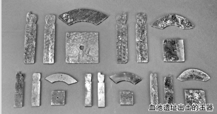
血池遗址出土的玉器